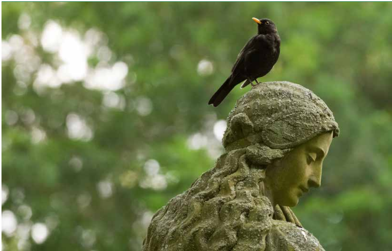
Amsel im Engelshaar