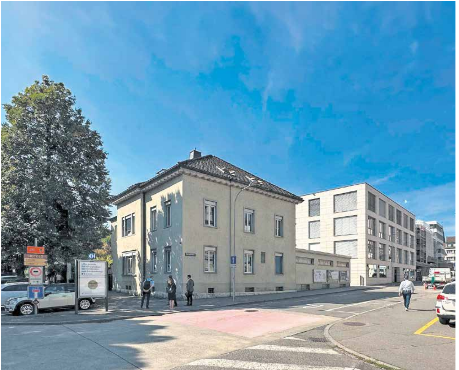
Die ehemalige Missionsprokura bleibt kirchlichen Zwecken erhalten.