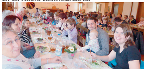
Zufriedene Gesichter im vollbesetzten KGH

Nicht einzelnen, sondern möglichst allen soll zu Gute kommen, was auf der Erde wächst. Im ökumenischen Gottesdienst durften Kinder eine Palette bepflanzen. Sobald es wärmer wird, können sich alle vor der Kirche von deren Früchten bedienen. Mit dem Verkauf der ‚Samenbomben‘ sammelten die Schulkinder Fr 164.– zugunsten der Hilfswerke. Das feine Pastaessen mit Dessert bereitete sichtlich Freude. Vergelt's Gott allen, die die Aktion unterstützt haben.