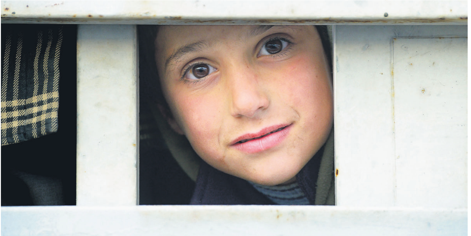
Mossul, 27. Januar 2017: Ein Kind fährt auf einem Lastwagen zu einem Flüchtlingslager für vertriebene Familien.