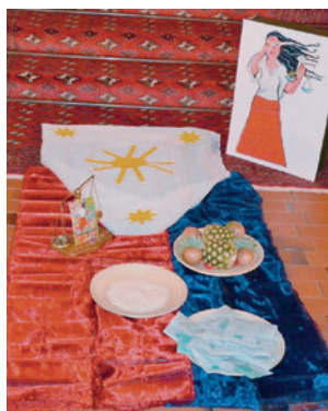
Weltgebetstag der Frauen am 3. März, Gastland: Philippinen