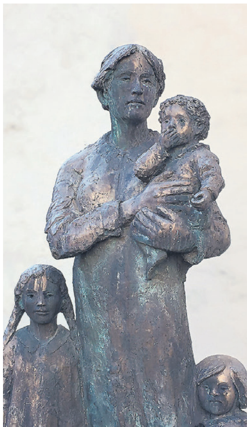
Dorothee von Flüe mit drei Kindern beim Abschied (Figurengruppe von Rolf Brem hinter dem Turm der Kirche in Sachseln).

Niklaus von Flüe wurde aber nicht von einer Firma irgendwohin gerufen, sondern von Gott.