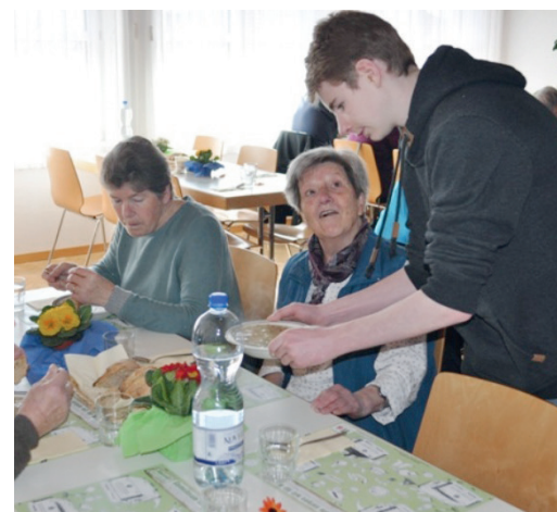
ökum. Suppentag vom 25. Februar