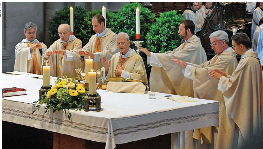
«Der Geist heilige diese Gaben, damit sie uns werden Leib und Blut unseres Herrn Jesus Christus.» Herabrufung des Heiligen Geistes in der Eucharistiefeier.

Die Schwierigkeit, über den Heiligen Geist zu sprechen, die viele Christen bekunden, rührt daher, dass man ihn nicht isoliert von seinem Wirken beschreiben kann. Das hebräische Wort für die göttliche Geistkraft, ruach, bedeutet auch Wind, Bewegung, Atem, Le-