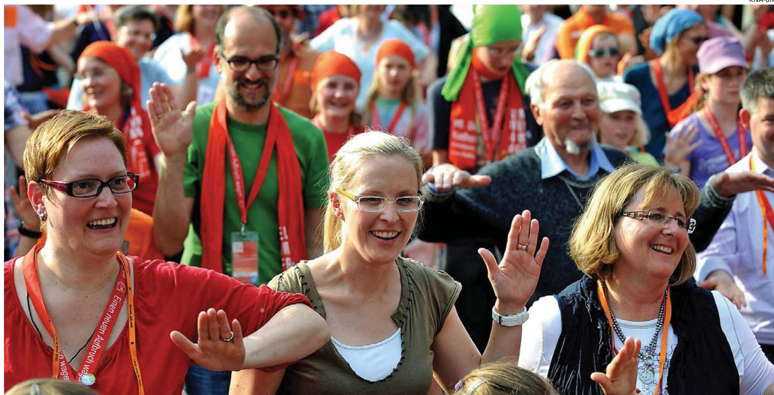
Der Geist weht wo er will. Auch am Deutschen Katholikentag 2012 in Mannheim unter dem Motto «Einen neuen Aufbruch wagen».