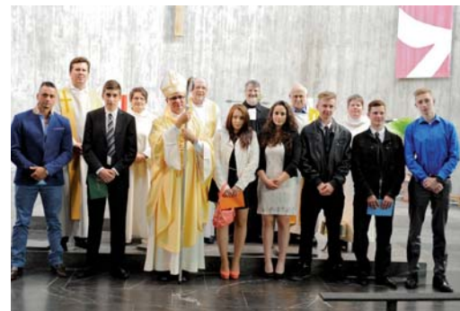
Gruppenfoto mit Bischof Felix Gmür nach dem Jubiläumsgottesdienst vom 25. Mai .

Am Mittwoch , 18. Juni , um 12.45 Uhr treffen wir uns bei der Kirche und fahren mit den Autos nach Erlinsbach, wo wir eine Rundwanderung machen. Auf eine gemütliche Wanderung freut sich die Leitung