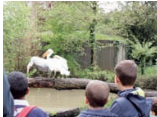
Ein Pelikan breitet mit Imponiergehabe seine Flügel aus.