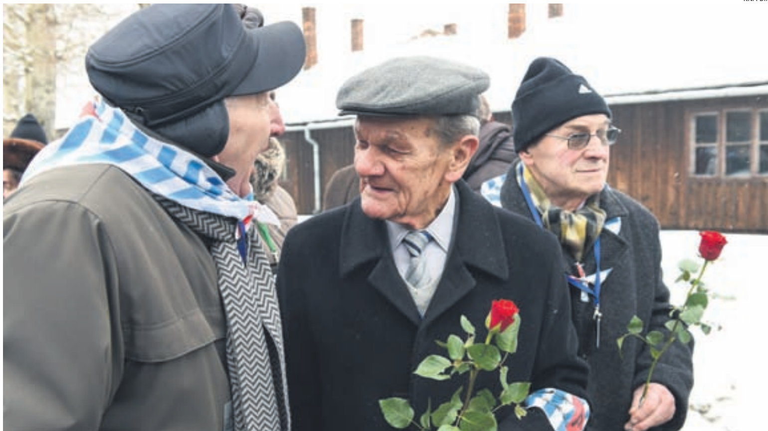
«Was kann helfen, so viel Leid zu tragen?»: Ehemalige Häftlinge des Konzentrations- und Vernichtungslagers Auschwitz am 70. Jahrestag der Befreiung am 27. Januar 2015. Auschwitz war eines der vier Lager, die der jüdische Arzt Viktor Frankl überlebte.