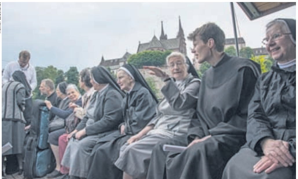
Im gleichen Boot: Die Ordensleute überqueren den Rhein mit der Münsterfähre in Richtung Grossbasel.

Beim Rundgang verbanden sich Vergangenheit und Gegenwart, etwa mit dem Mittagessen im Kloster «Prophet Elias», das von indischen Karmeliten geführt wird. Der «Fort-Schritt» führte die Ordensleute zum Klingental, der St. Clarakirche und zum Münster,