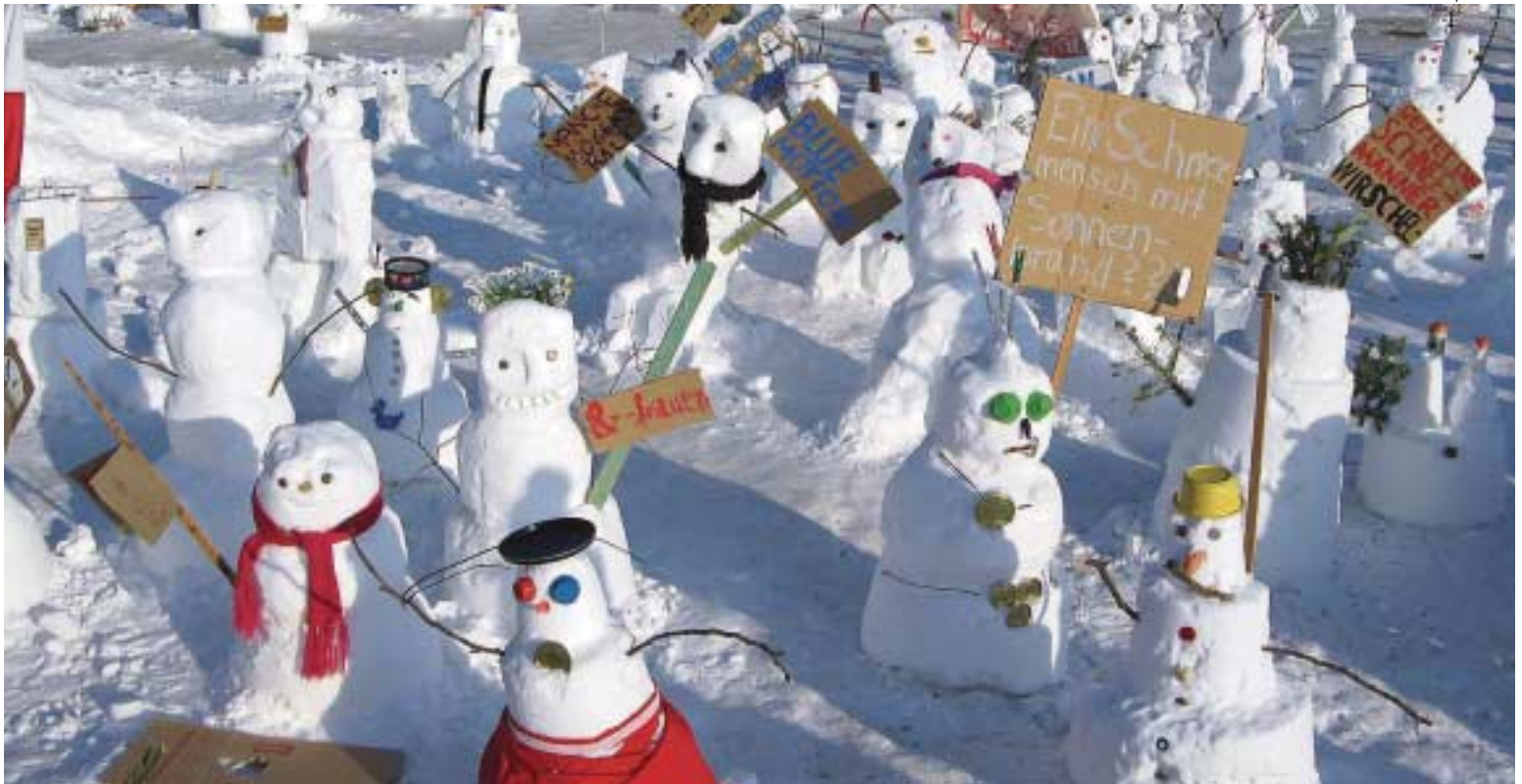
Demonstrierende Schneemänner als Propheten der Erderwärmung? Was als Protest daher kommt, ist in Wirklichkeit die Werbeaktion eines Stromanbieters.