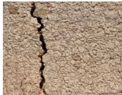
Ein Trauma ist, wie wenn der Boden unter den Füssen bricht.

Zur Traumatisierung gehören starke Gefühle der Hilflosigkeit. Diese Gefühle halten oft an, obwohl die bedrohliche Situation schon lange vorbei ist.