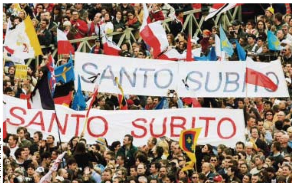
Pilger auf dem Petersplatz fordern am 16. April 2005 die Heiligsprechung des verstorbenen Papstes Johannes Paul II.

Die Stadt Rom rechnet für den 27. April, dem Tag der Heiligsprechung der beiden Päpste Johannes XXIII. und Johannes Paul II., mit bis zu fünf Millionen Besuchern und Besucherinnen. Das wäre die grösste Menschenansammlung in der Ewigen Stadt, noch mehr als bei der Beisetzung des polnischen Papstes Johannes Paul II. im Jahr 2005 und bei der Seligsprechung vor drei Jahren. Die gemeinsame Kirchenehrung für die beiden Päpste war ein ausdrücklicher Wunsch von Papst Franziskus.