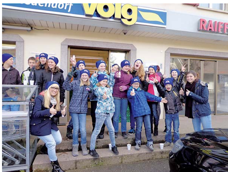
Jugendliche in Neuendorf und Gretzenbach

Aus Überzeugung können wir sagen: Unsere Jugend ist sozial, kollegial und genial.