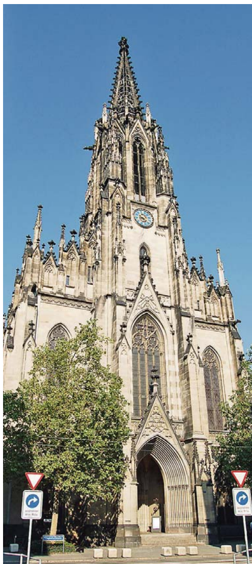
Citykirchen (wie die Basler Elisabethenkirche), wo man unangemeldet für ein Gespräch auftauchen kann, haben für psychisch Kranke eine wichtige Funktion.

In solchen Gesprächen ist es für mich wichtig, dass Seelsorger erkennen, wann ich tatsächlich überfordert bin, und mir das dann auch glauben. Selbst wenn das manchmal spirituellen Grundprinzipien widerspricht. Es gibt zum Beispiel Situationen, in denen ich sage: «Ich brauche unbedingt Kontakt zu Person X.» Eine übliche seelsorgerliche Reaktion ist dann: «Es kann sein, dass die Person sich mel-