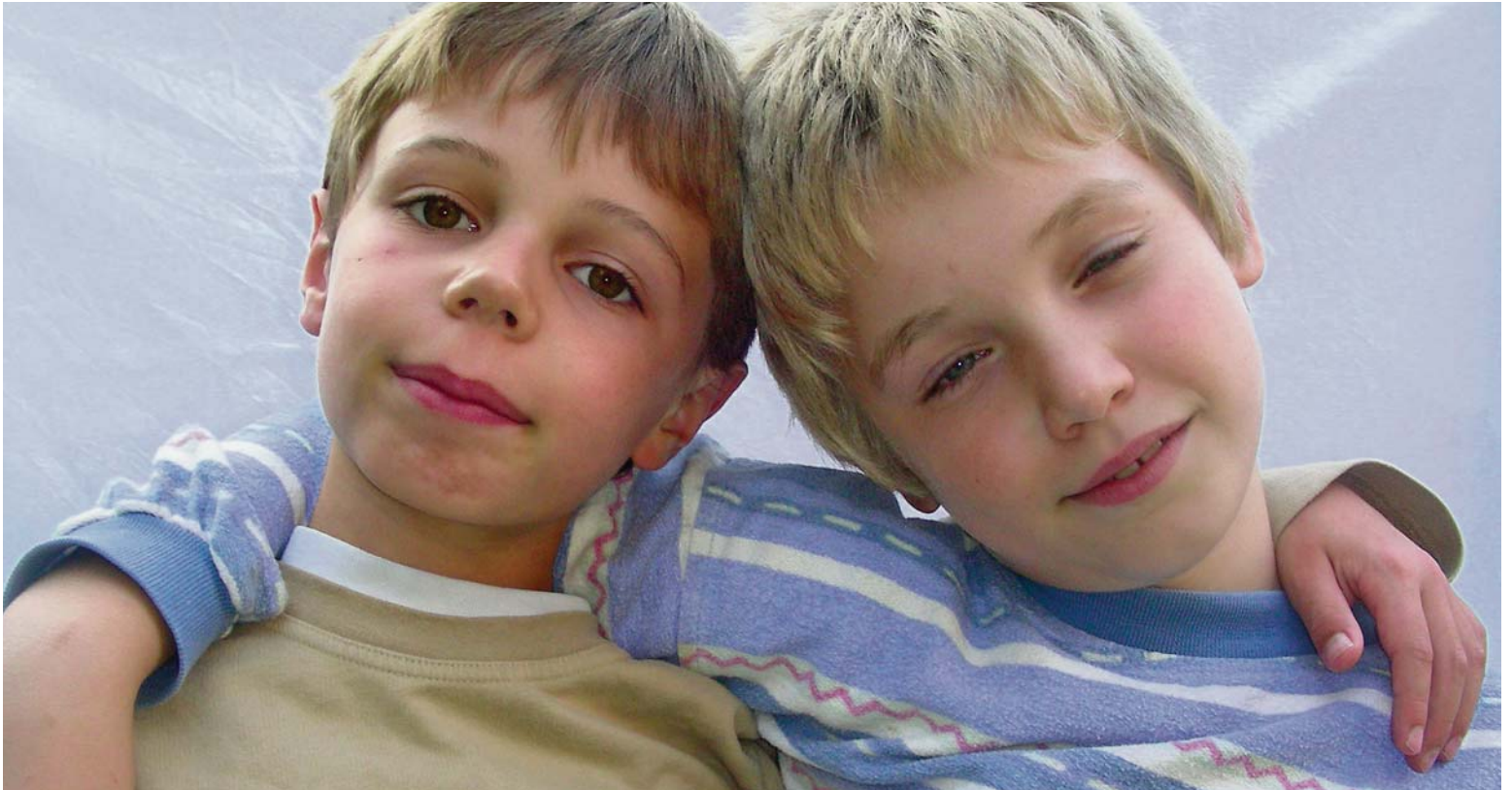
Sich auf Freundschaft einzulassen, ist gegenseitig: Beste Freunde.