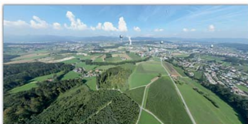
Luftbildpanorama des südlichen Niederamtes

Däniken Dulliken Gretzenbach Schönenwerd Walterswil Zweckverband