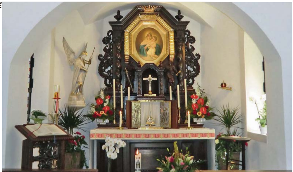
Der Altar in der Marienkapelle in Vallendar, dem «Urheiligtum» der Schönstatt-Bewegung.

Die Spiritualität der Bewegung ist gemäss ihrer Selbstdarstellung geprägt vom Glauben an die Führung Gottes im alltäglichen Leben. Die ihr angeschlossenen Menschen sollen In-