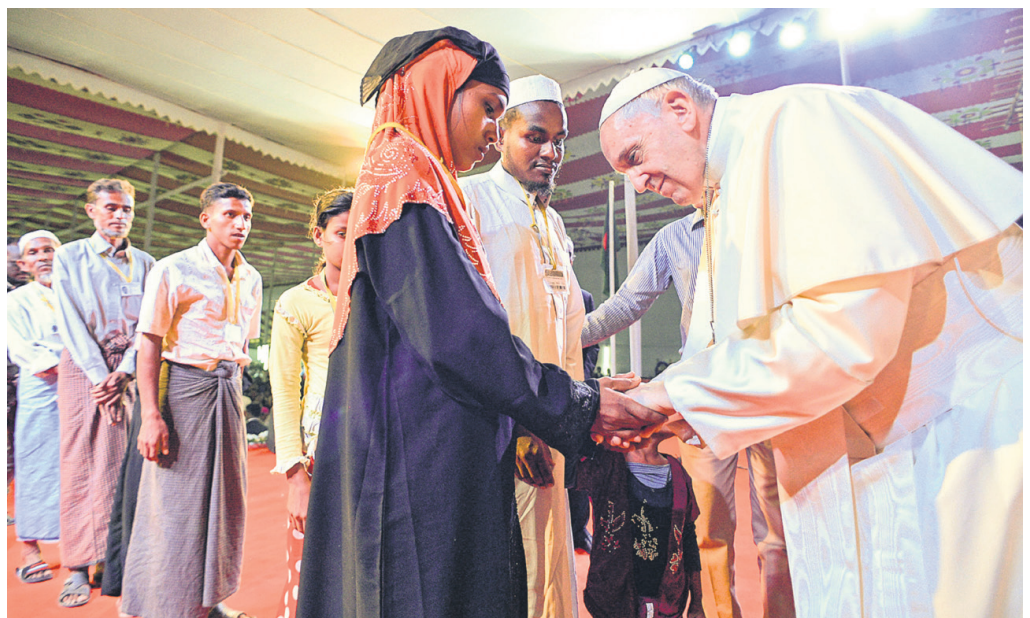
Papst Franziskus trifft am 1. Dezember 2017 in Dhaka im Garten des Bischofshauses mit Flüchtlingen der Rohingya zusammen.

Wie heikel der Besuch im früheren Burma war, illustriert eine Programmänderung durch die Armeeführung. General Min Aung Hlaing hatte sein Treffen mit Franziskus kurzfristig von Donnerstag auf Montag, den Tag der Ankunft des Papstes, vorverlegt. Ob dies aus Termingründen erfolgte oder um dem Gast klarzumachen, wer die Macht im