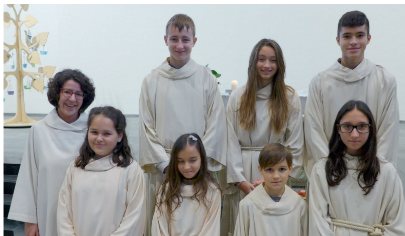
Ministrantenaufnahme und -verabschiedung vom 26. November

Am Freitag, 15. Dezember , findet um 17.00 Uhr unsere Weihnachtsfeier im ev.-ref. Kirchgemeindehaus statt.