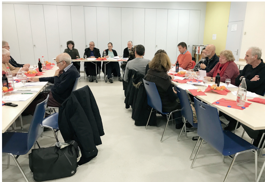
Ab dem 1. Januar schliessen sich die Kirchgemeinden Trimbach und Wisen zusammen. Die zukünftige Einheitskirchgemeinde hat sich zur ersten Budgetversammlung getroffen. Bericht von Rita Bloch auf Seite 9, Wisen.