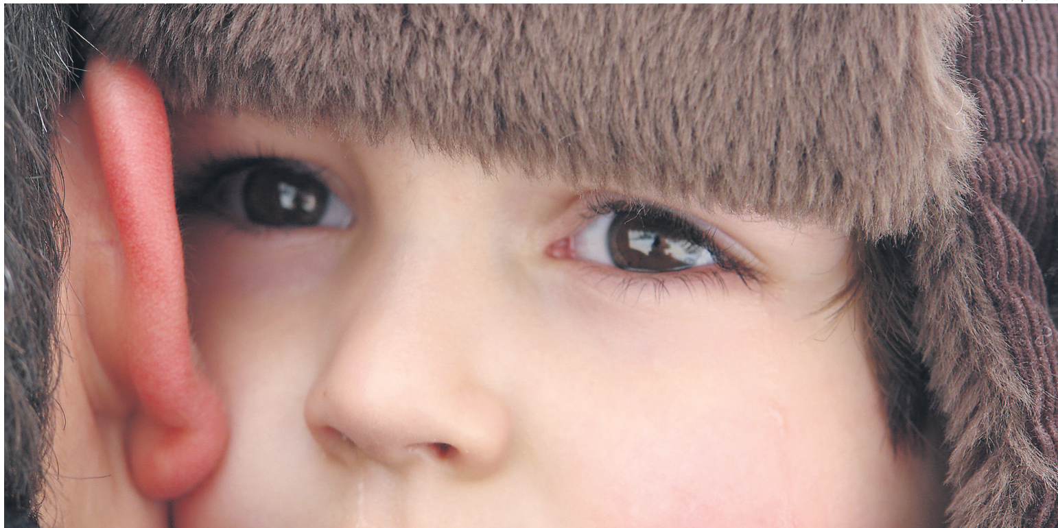
Ein trauriger Bub sucht Trost beim Vater.