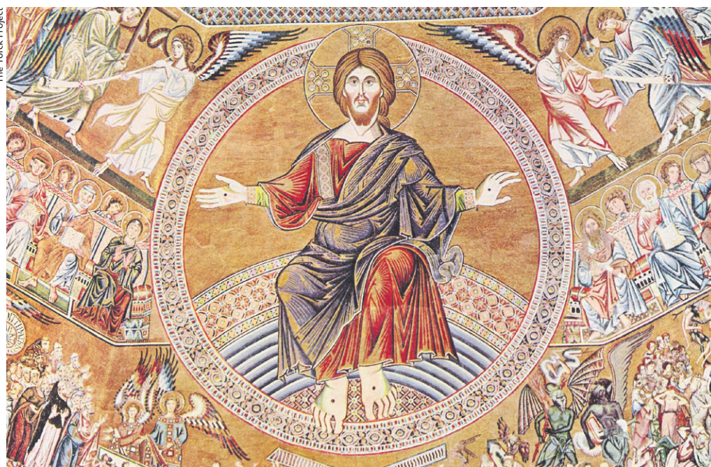
Einst wird er als Weltenrichter seine Herrschaft offenbaren. Christus als Pantokrator im Baptisterium in Florenz.

Indem die O-Antiphonen Gottes Taten wie den Auszug aus Ägypten («O Adonai, auf dem Berg hast du dem Mose das Gesetz gegeben») Jesus zuschreiben, denken sie die Mensch-