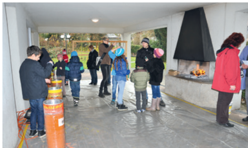
Rückblick aufs Kerzenziehen 2014

Alle, auch Familien mit kleinen Kindern aus Schönenwerd, sind herzlich eingeladen.