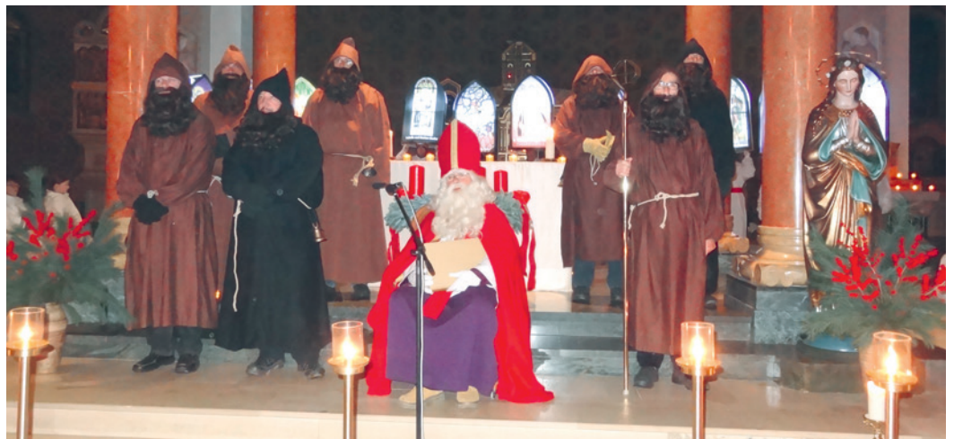
Rückschau St. Nikolausaussendung vom 29. November 2015: Feierliche Intronisierung des St. Nikolaus in der St. Martinskirche