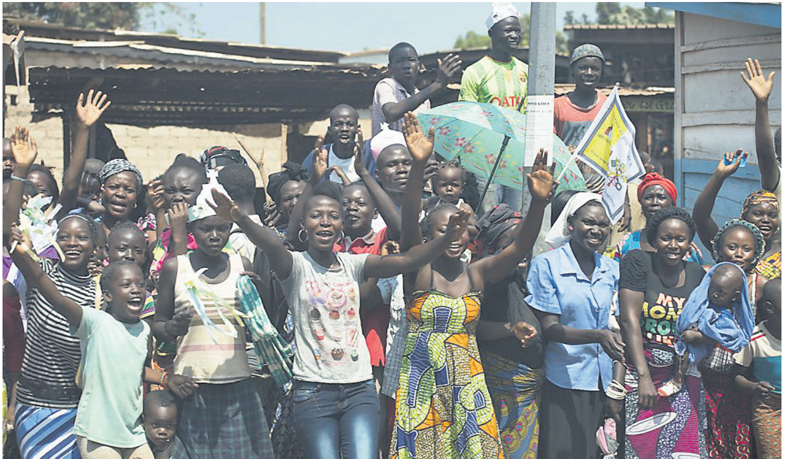
In Afrika jubeln Menschen dem Papst zu.