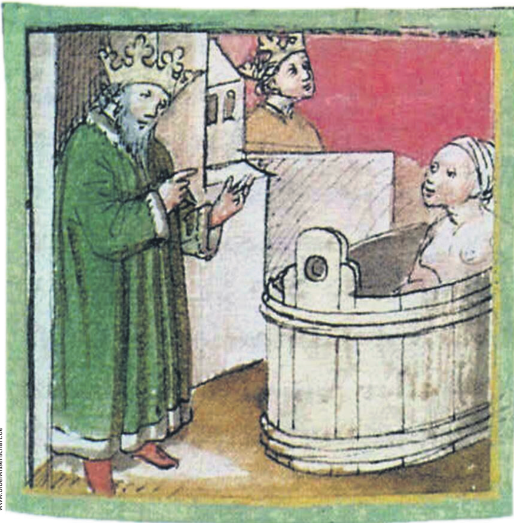
David sieht Batseba baden. Illustration aus dem Codex Germanicus 206, 1457.

Eine Frau, die sich vom Opfer zur die Geschichte bestimmenden Figur entwickelt