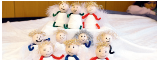
Liebevoll gestaltete Engel der Viert-, Fünft und Sechsklässler während den Sternstunden

Samstag, 12. Dezember für die 4., 5. und 6. Klässler 16.30 bis 18.00 Uhr im Sigristenhaus unter der Leitung von Nadja Lutz. Bitte anmelden unter nadja.lutz@gmx.ch