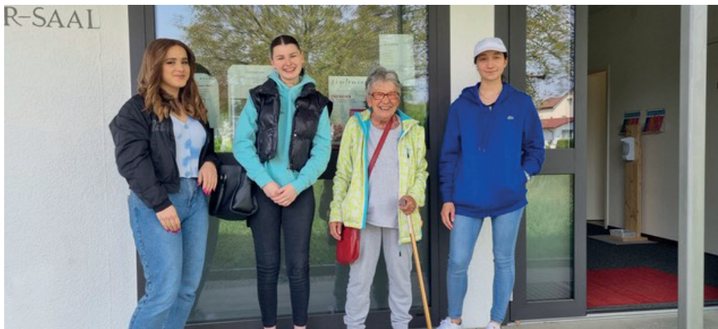
Anlass vom 7. Mai mit den Firmand:innen zum Thema «Tablet, Handy und Laptop – auch als Senior:innen vernetzt bleiben»