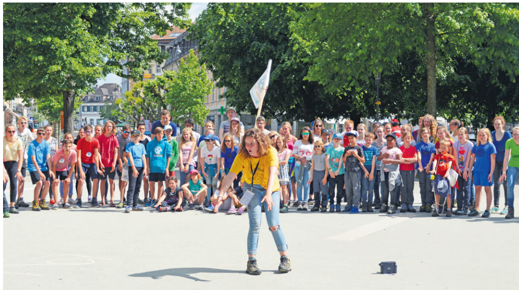
Hunderte von Kindern und Jugendlichen aus den Jubla-Scharen des Kantons Solothurn werden vom 4. bis 6. Juni das Niedergösger Inseli bevölkern (Aufnahme von Kapfala 2018).

Über Pfingsten wird das Niedergösger Inseli zur Zukunftsstadt der Jubla Kanton Solothurn