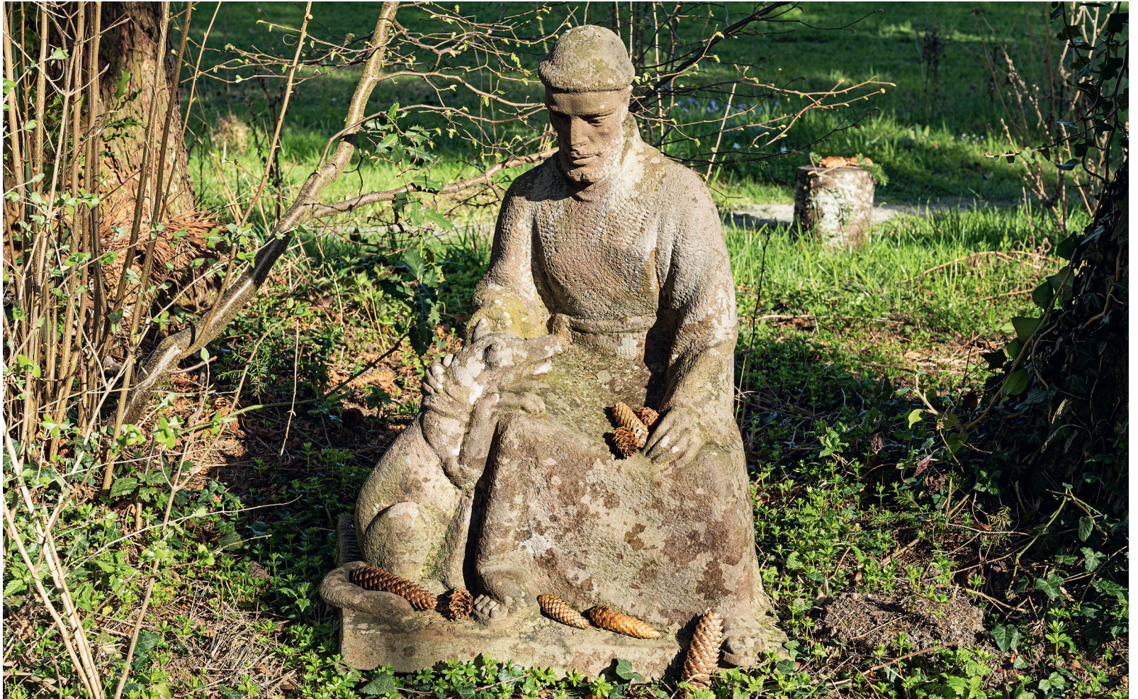
Franziskus mit dem Wolf von Gubbio, Kapuzinerkloster Wesemlin Luzern