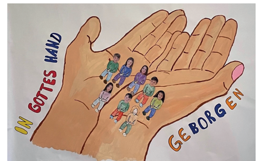
Erstkommunion vom 15. Mai

Wir wünschen allen schöne und sonnige Frühlingstage.