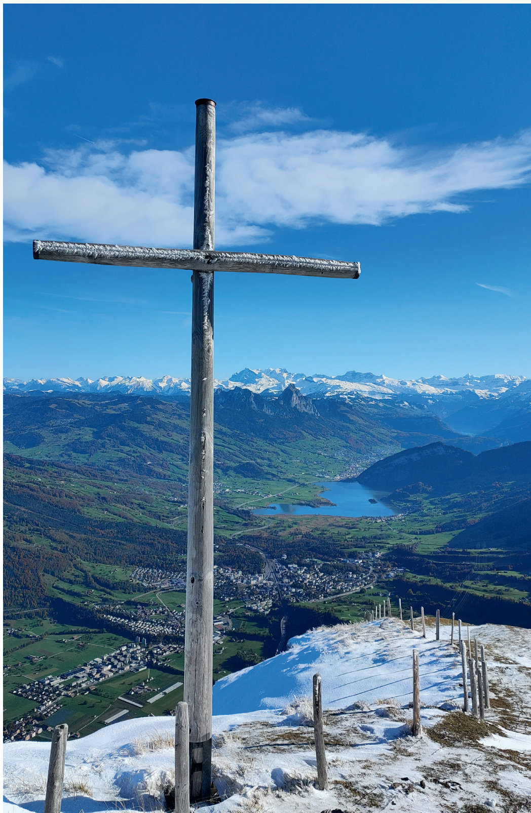
Bild von der Rigi Kulm, Richtung Schwyz, Mythen im November@Pastoralraum Olten