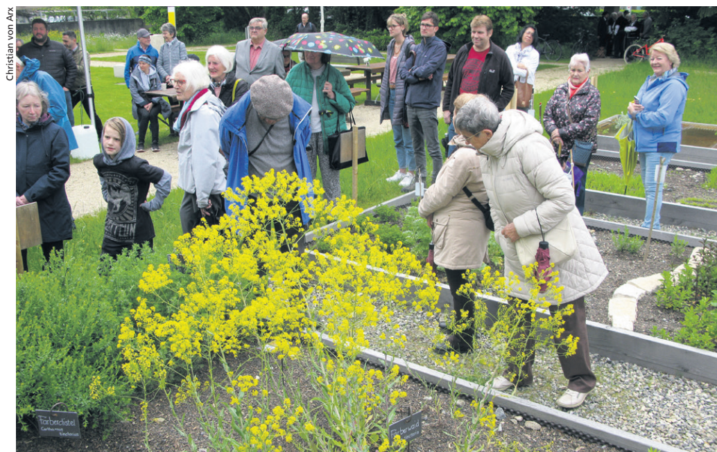
Trotz des wechselhaften Wetters war das Einweihungsfest am 14. Mai gut besucht. Im Vordergrund das Beet mit den Färbepflanzen.

Alle Informationen auf www.religionsgarten.ch .