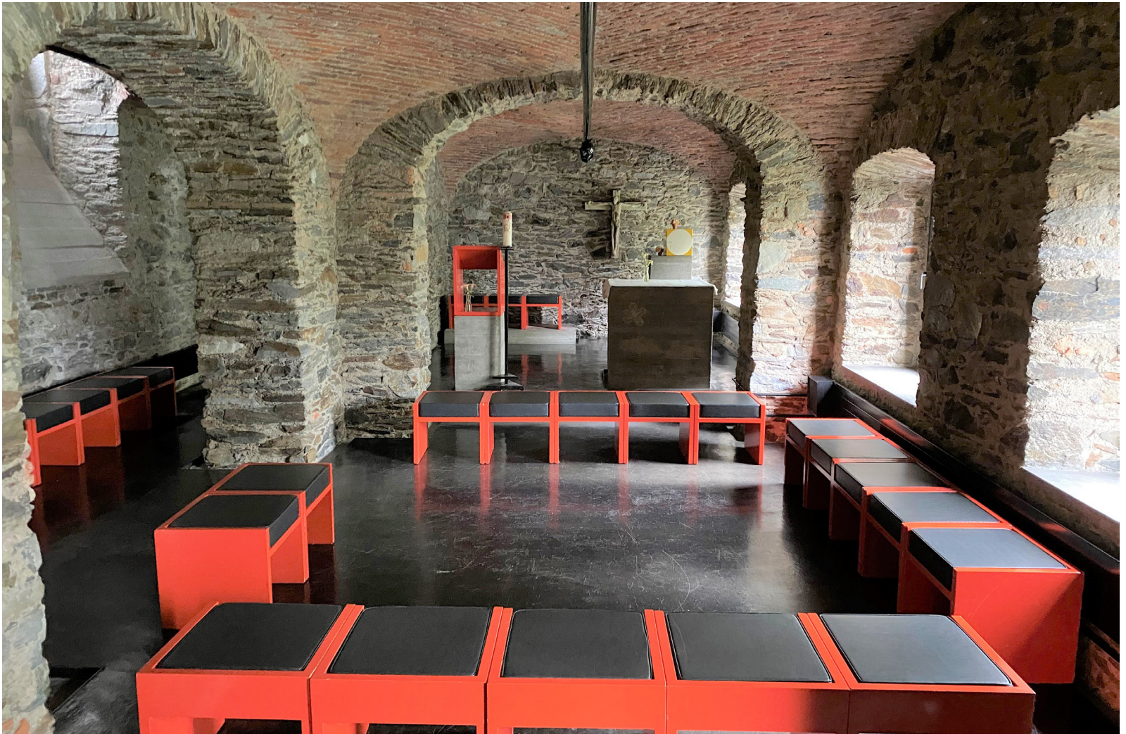
Bigorio, das älteste Kapuzinerkloster der Schweiz. Kapelle im ehemaligen Holzschopf, gestaltet von Mario Botta als Student @Pastoralraum Olten