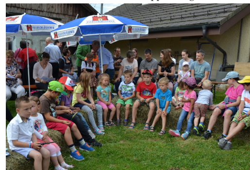
Archivbild Chinderfiir Hofchäsi Schmid

Chinderfiir Team Däniken-Gretzenbach-Schönenwerd-Eppenberg-Wöschnau.