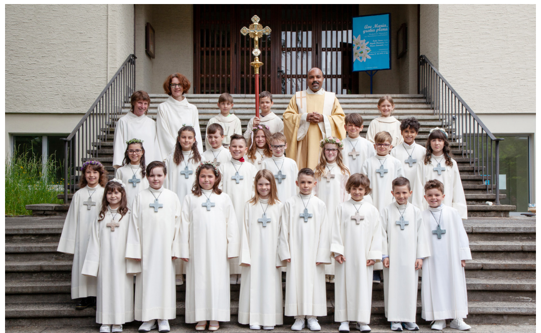
Erstkommunion vom 14. Mai 2023

Am Sonntag, 18. Juni , feiern wir unser ökumenisches Sommerfest auf dem Bühli.