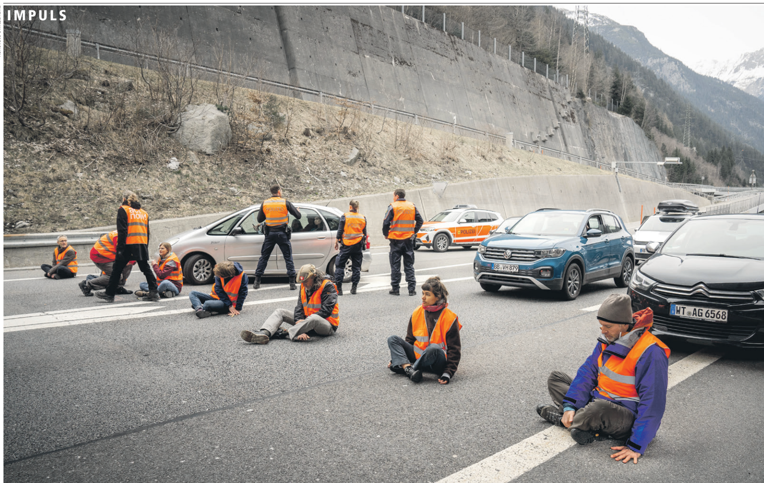
Blockade des Osterverkehrs vor dem Gotthardtunnel der A2 bei Göschenen am Karfreitag, 7. April, durch sieben Klimaaktivisten von 19 bis 64 Jahren.