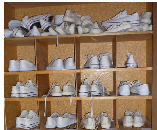
Bild: Minischuhe in der Sakristei Däniken