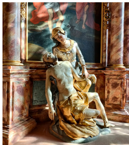
Bild aus Stiftskirche St. Ursanne JU