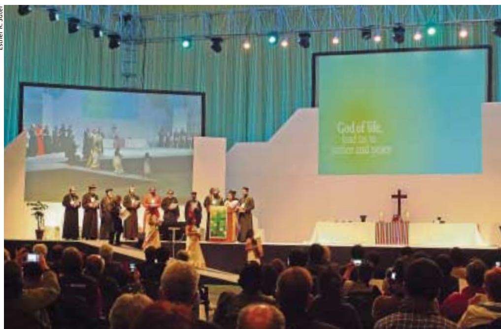
Gottesdienst in der Versammlungshalle im Rahmen der ÖRK-Vollversammlung.

Die Vollversammlung beschloss für die Periode bis zur nächsten Vollversammlung im Jahr 2020 eine «Pilgerschaft für Gerechtigkeit