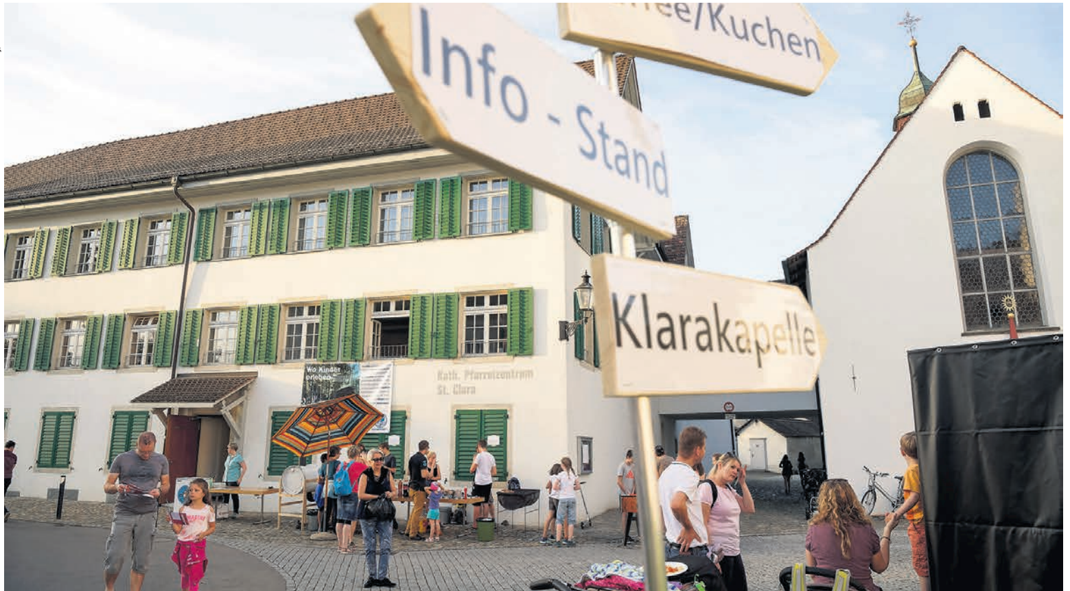
Lange Nacht der Kirchen 2018: Wegweiser vor der Kirche Bremgarten.