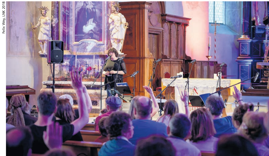
Comedy statt Gottesdienst: An der Langen Nacht der Kirche 2018 ist die Slam-Poetin Patti Basler in der Kirche Bremgarten AG aufgetreten.

Trimbach führt von 16 bis 21 Uhr alle Generationen bei der Johanneskirche zusammen, mit Verpflegung auf dem Kirchenplatz. Für Kinder und Jugendliche gibt es die Hüpfkirche und eine Schatzsuche. Es singen der Kinder- und Jugendchor Trimbach, der Mauritiuschor und der Gospelchor Trimbach. Vor Sonnenuntergang kann der Kirchturm bestiegen werden. Der Abend klingt mit Taizé-Liedern aus.