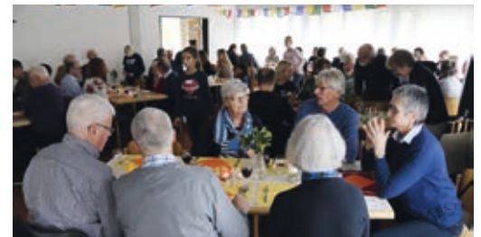
Rückblick: Missionssonntag 2019

Die Entwicklung der Corona-Pandemie und die entsprechenden Bestimmungen werden entscheiden, ob und in welchem Rahmen ein Apéro stattfinden kann.