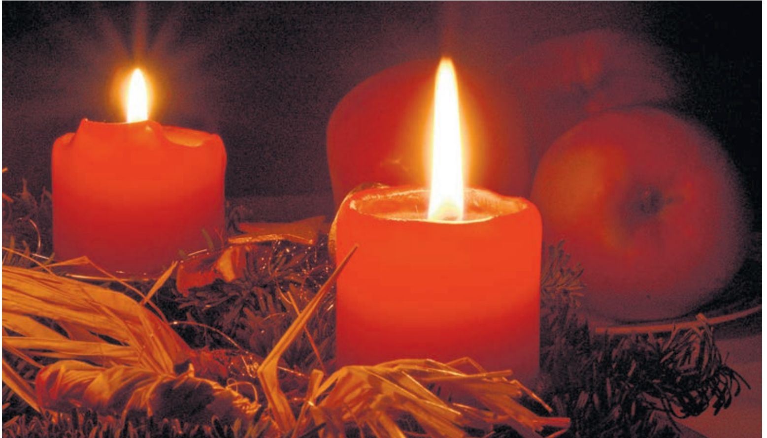
Die Aktion «Trotzdem Licht» will Menschen verbinden, die das besondere Weihnachtsfest 2020 auch besonders feiern möchten.