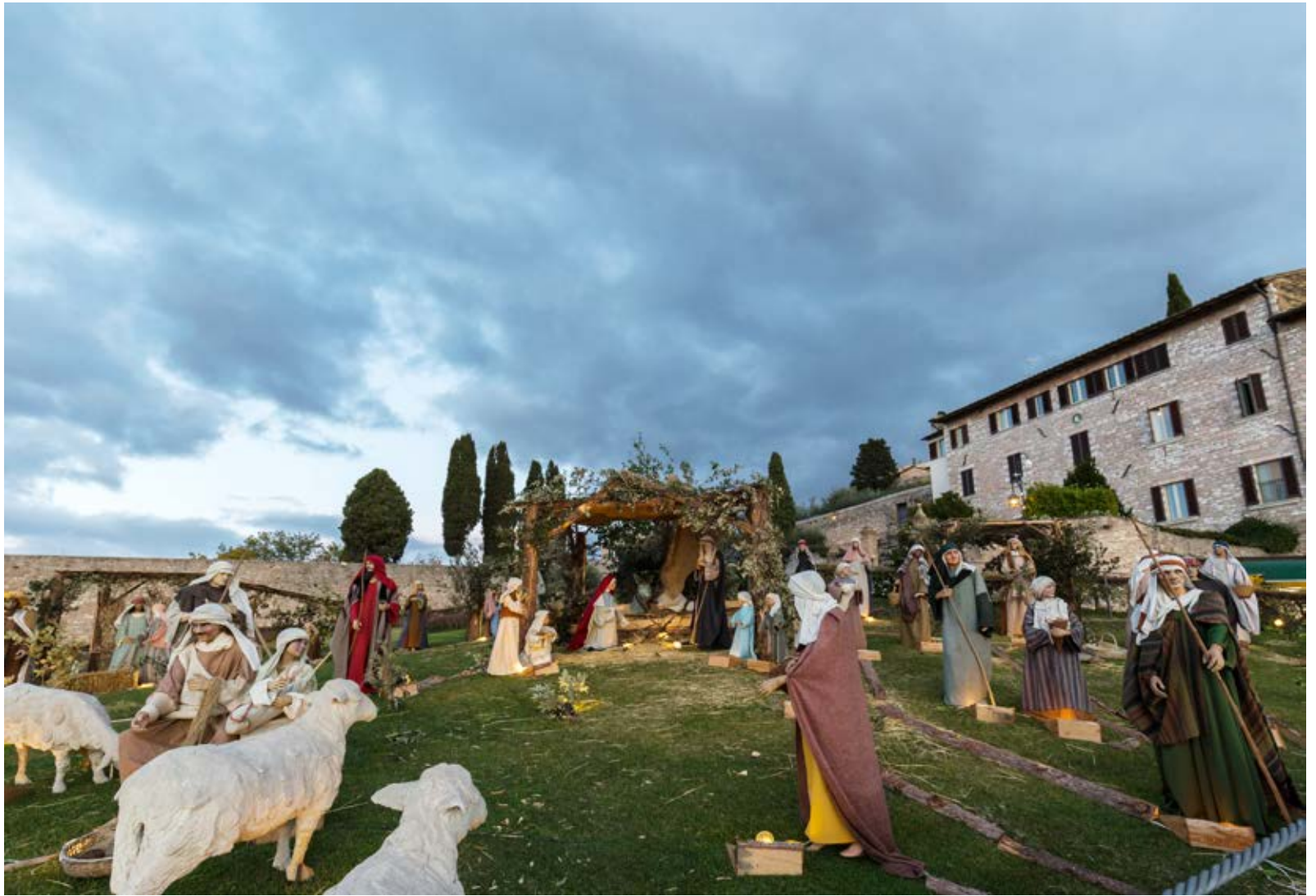
Krippe bei der Basilica San Francesco in Assisi