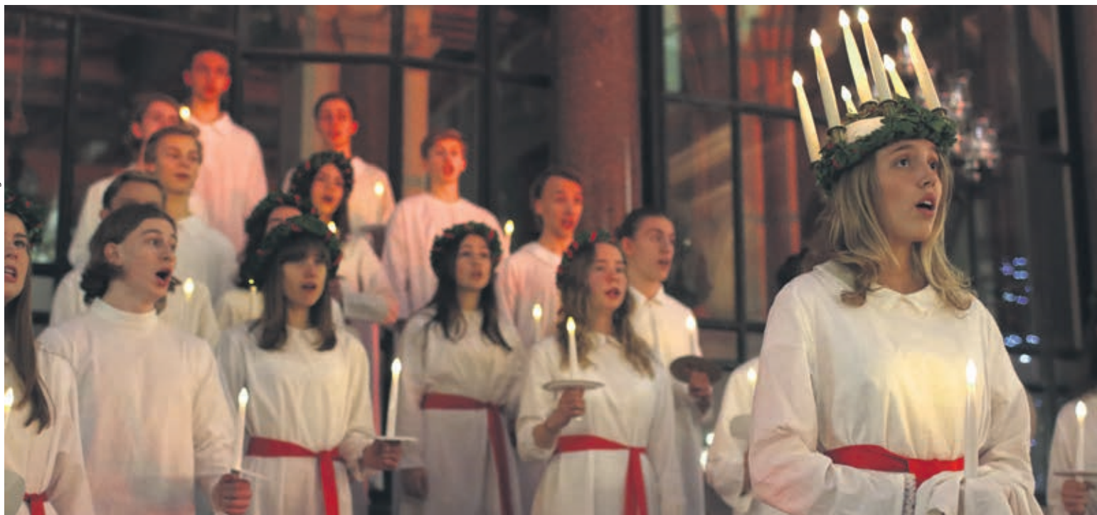
In Schweden stellt am Luciafest ein Mädchen mit Lichterkrans die heilige Lucia dar.