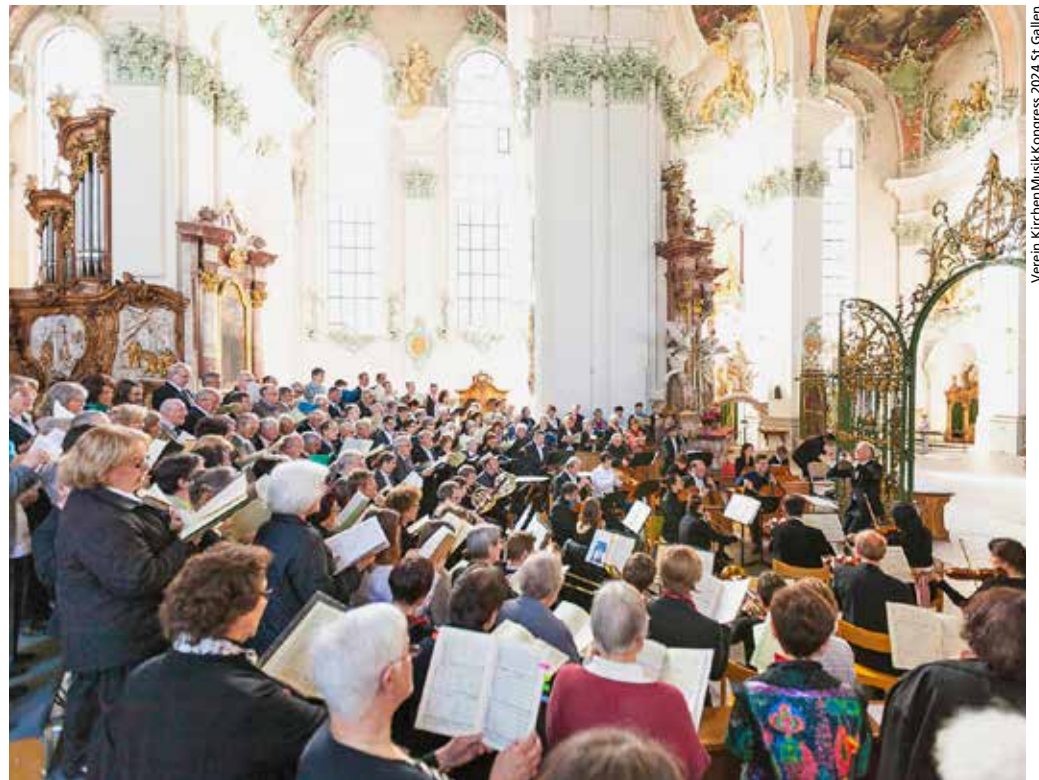
Verein KirchenMusikKongress 2024 St. Gallen

Welche Rolle spielt Musik für die Zukunft der Kirche, und welche Kirchenmusik hat Zukunft? Antworten auf diese Fragen wurden am internationalen Kirchenmusikkongress besprochen, der vom 9. bis 12. Mai in St. Gallen stattfand. Im Rahmen dieser Fachtagung gab es Gottesdienste und mehrere öffentliche Konzerte.