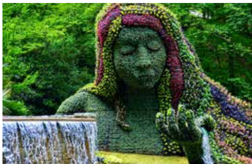
Atlanta Botanical Garden